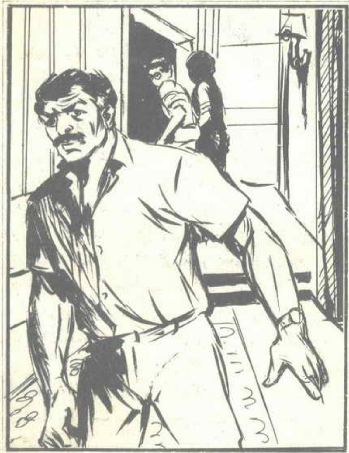
وقبل أن يظرقوا الباب وصل إلى أسماعهم صوت باب حجرة « عباس » يفتح ..

صرخة .. لولا أنه تمالك نفسه في الوقت المناسب .. قال « طارق » هامساً : لا يوجد أى دليل على وجود الثروة .. نأمل أن نجد شيئاً بالدور العلوى .. هل نستطيع أن نصعد الآن ؟