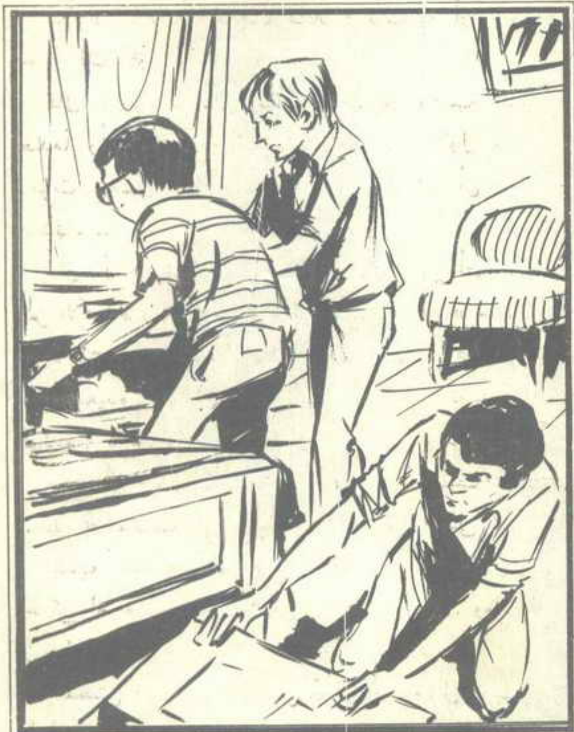
توجه « خالد » و « طارق » إلى حجرة « على »

اندهش « على » عندما سمع ذلك .. وقال : يبدو أن الحظ بدأ يبتسم لى .. فالقدر ساق الكرة إلى هنا في