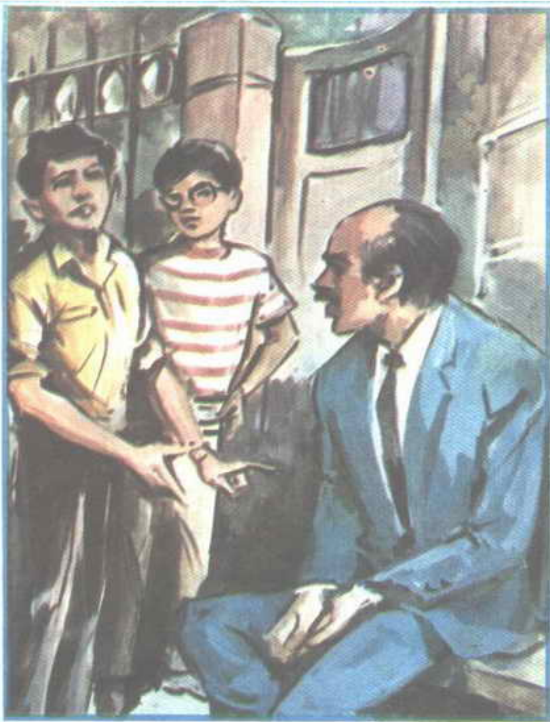
قال « خالد » : وجدنا شاباً يجلس على دكة أمام باب القبلا ..