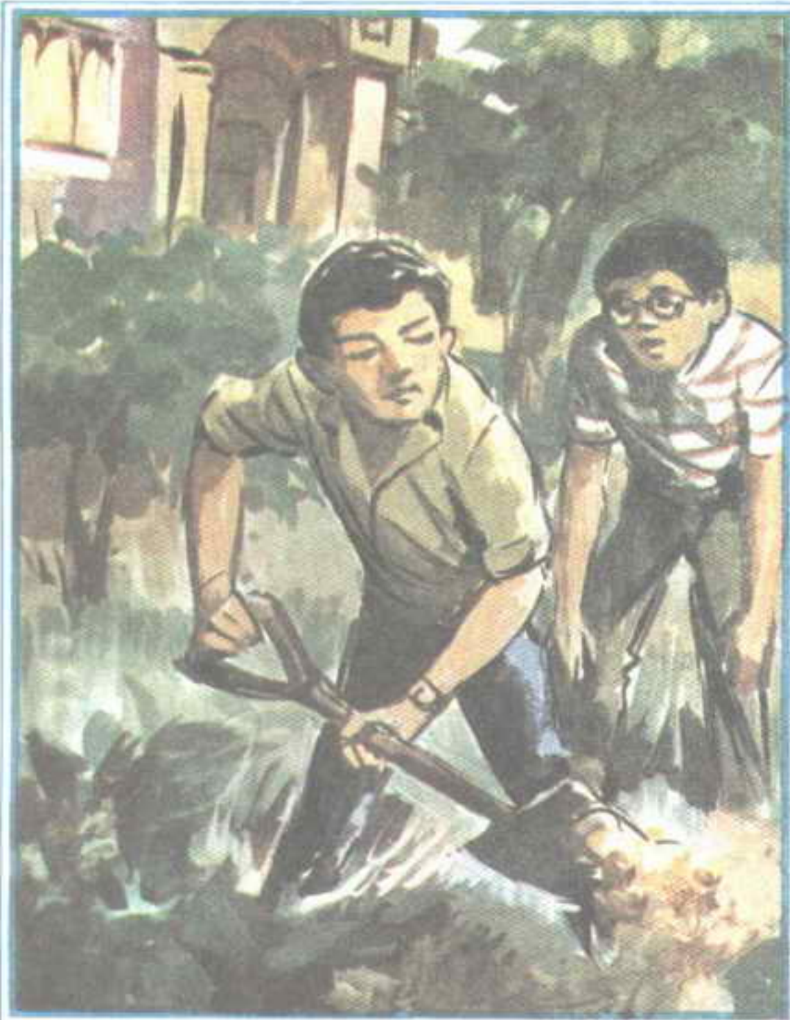
رقى وسط المسافة بين الشجرتين بدموا البحث ..

فقال « طارق » : لا بد أنه يعني شيئاً .. وليس مجرد لوحة مرسومة .