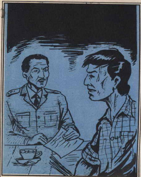
وقف « أشرف » أمام وكيل النيابة وهو يبرحس شراً .

أوماً الوكيل للشرطى ، الذى اقتاد « أشرف » إلى غرفة الحجز مرة أخرى .