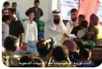
إثناء توزيع الناموسيات مع الكتيبات الدعوية