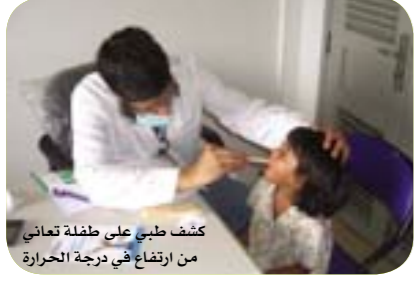
كشف طبي على طفلة تعاني من ارتفاع في درجة الحرارة