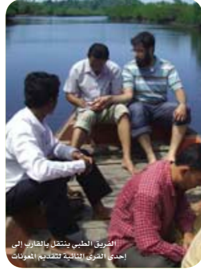
الفريق الطبي ينتقل بالقرب إلى إحدى القرى النائية لتقديم المعونات