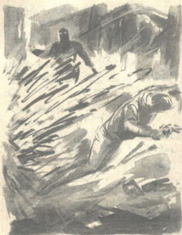
وانتزع من مكانه ، وطار به لسته أمتار كاملة في الهواء ، قبل أن يسقط في عنف وسط الأطلال

الذي انطلقت كراته النارية تسحقهم واحداً بعد الآخر . ولم يدرك ( أكرم ) ما الذي يمكن أن يفعله ، في موقف كهذا ، إلا أنه لم يستطع الوقوف ساكناً ، والرجال يقاتلون بهذه البسالة ، فوثب عبر جزء من حائط قديم ، وهتف ، وهو يطلق رصاصات مسدسه نحو الشاب :