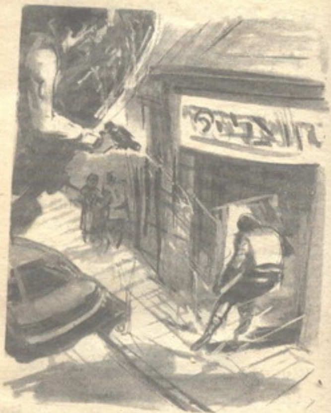
لقد انهالت عليه عشرات الرصاصات ، عند باب المتجر ، وفوجئء بإحداها تخترق كتفه ..

ازداد العقاد حاجبي ( أكرم ) فى شدة ، وهو يقول : - إذن فهذا هو .. هذا هو .